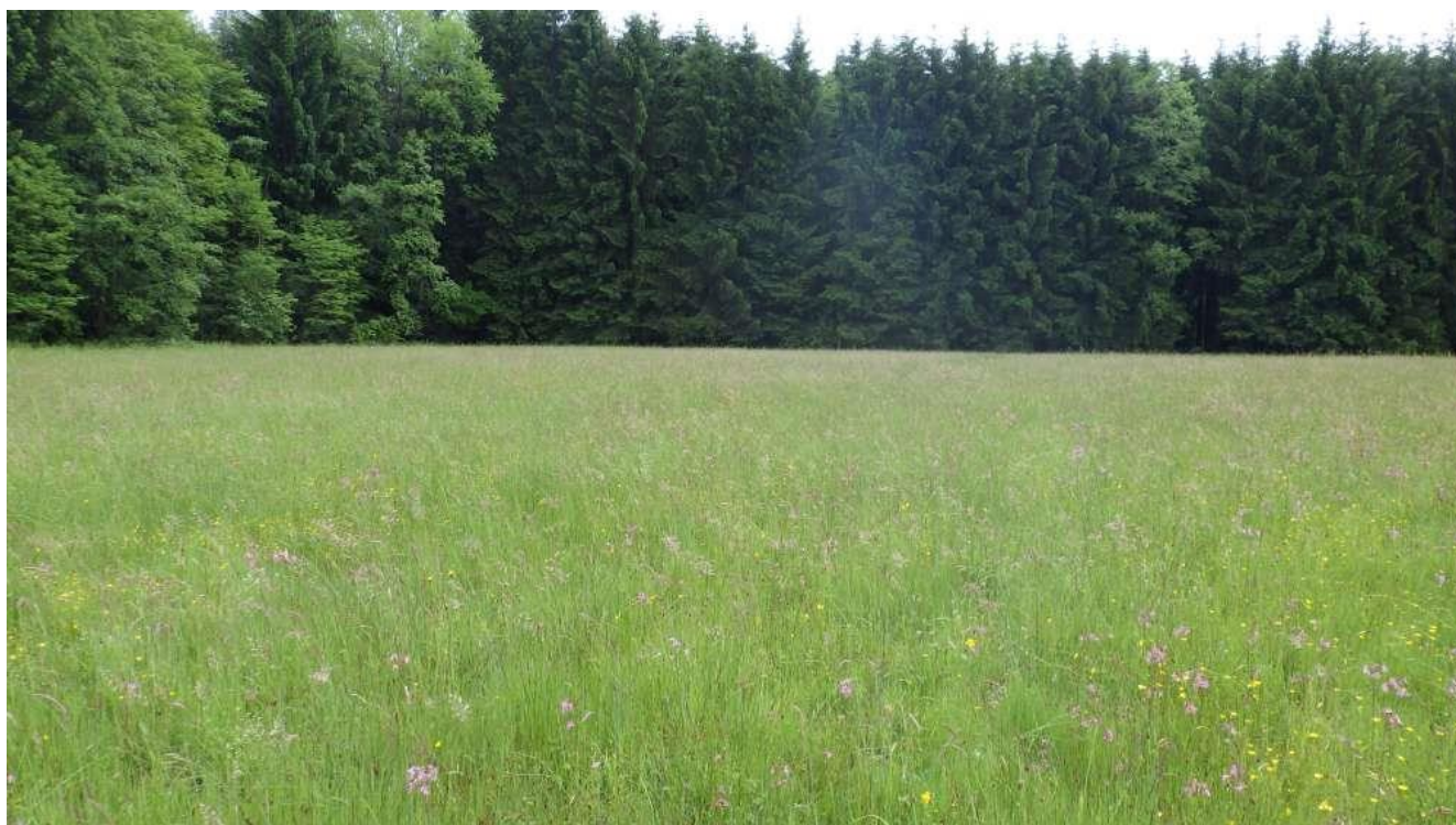
Prairie humide de fauche à Malbouhans ( Junco conglomerati – Scorzoneretum humilis )